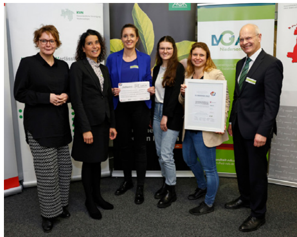
Preisträger Fit fürs Leben